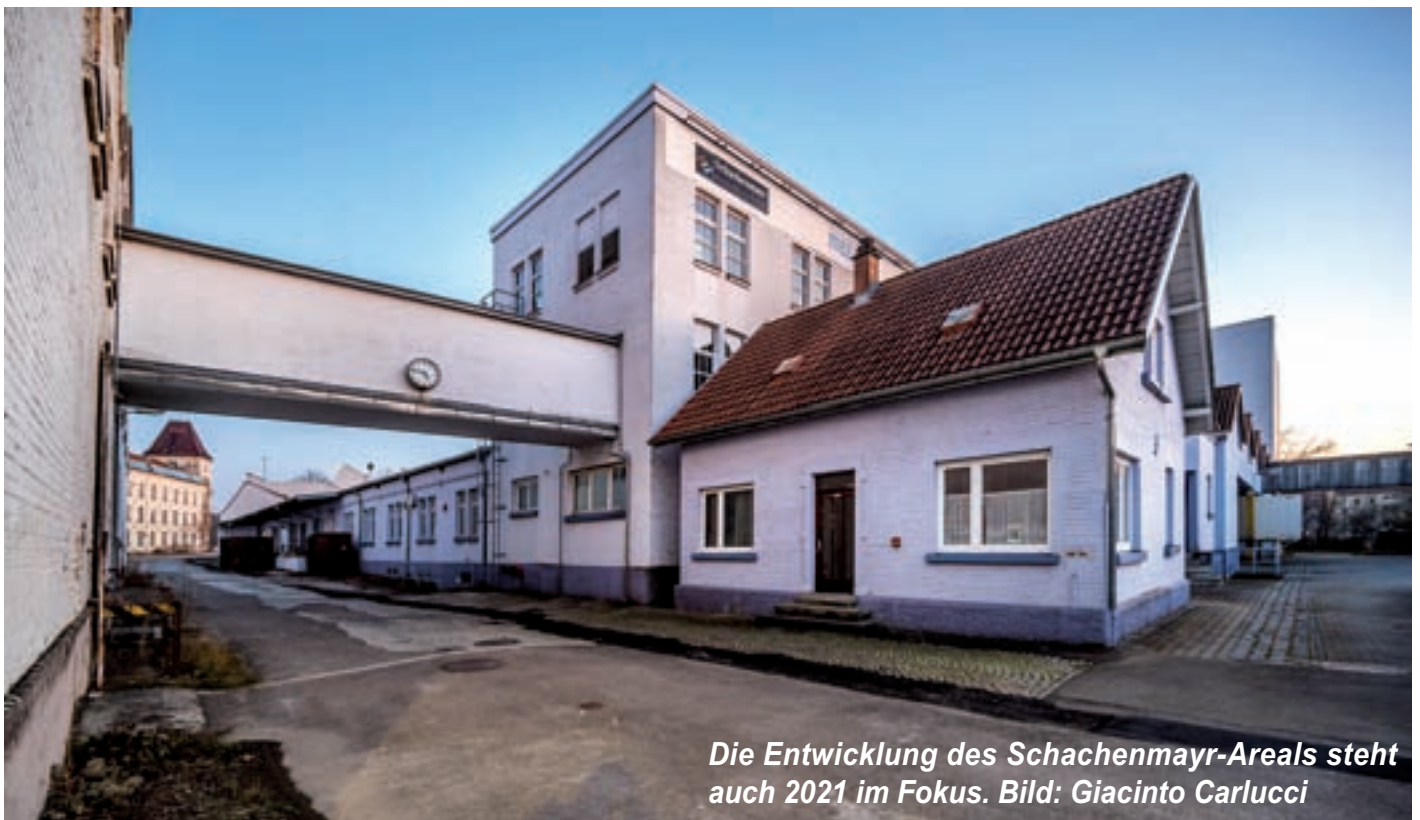
Die Entwicklung des Schachenmayr-Areals steht auch 2021 im Fokus.

Für den Breitbandausbau in Gewerbegebieten, Schule und Stauerlandhalle sowie zur Beseitigung von „weißen Flecken“ insbesondere in Außenbereichen erhält die Gemeinde umfangreiche Fördermittel. Der Eigenanteil der Gemeinde in Höhe von 10% der Gesamtkosten beläuft sich auf 390.000 €