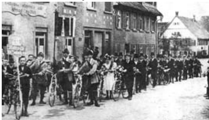
1924 Radfahrclub Salach bei einem Festzug vor dem Gasthaus zur Linde

Schon in den 20er Jahren gab es einen Radfahrclub in Salach.