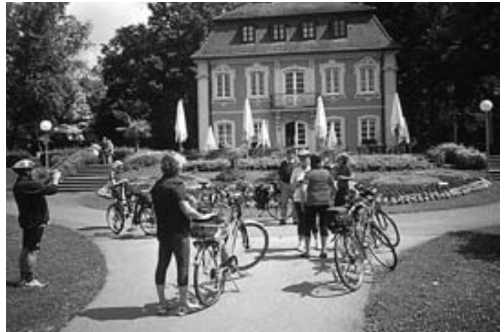
2009 Vor dem Rokokoschlösschen in Schwäbisch Gmünd

Bereits 1984 wurde das Radfahren in den Wanderplan aufgenommen. Zuerst wurde in Tagestouren der Kreis Göppingen erkundet.