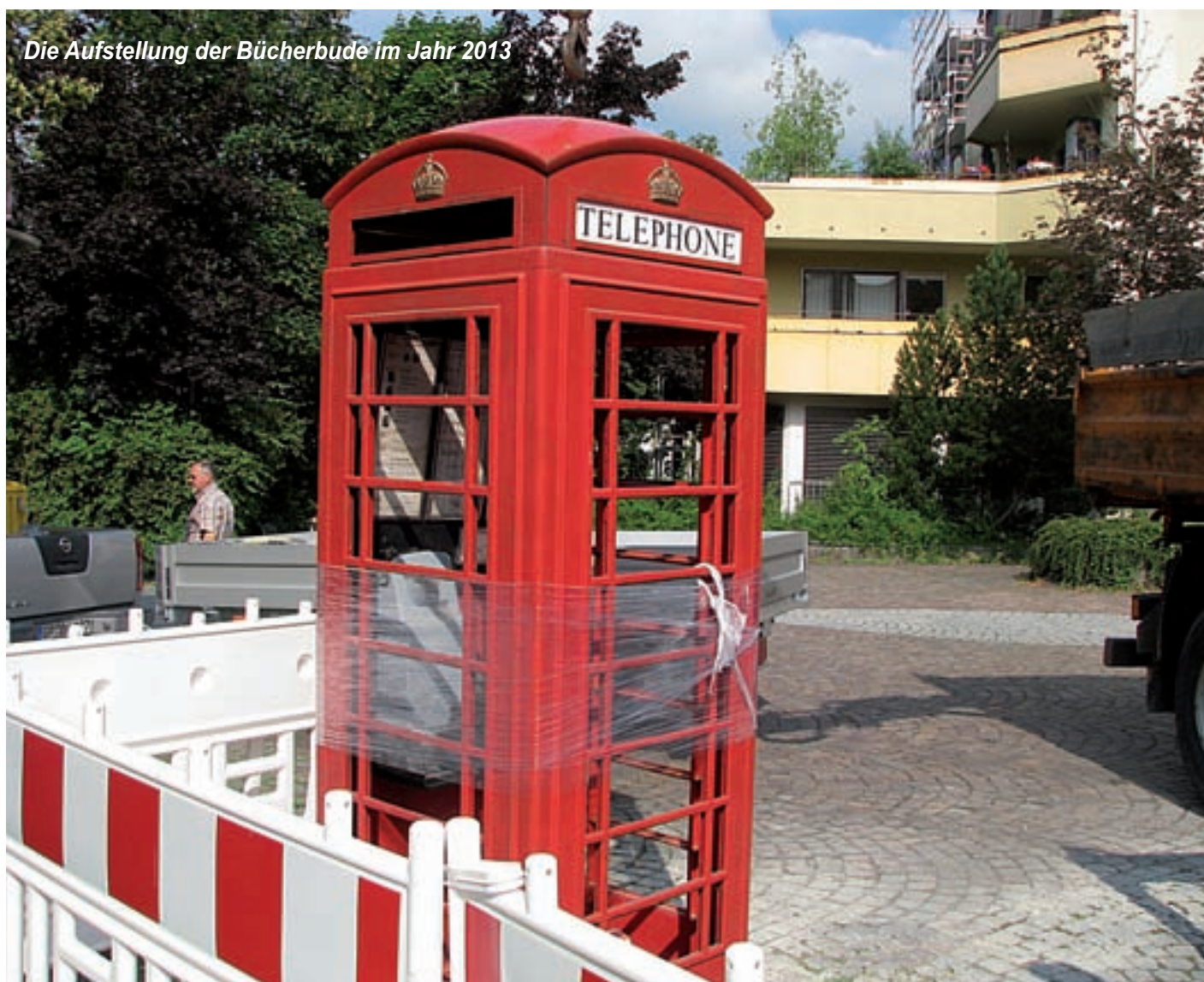
Die Aufstellung der Bücherbude im Jahr 2013

Wir bedanken uns herzlich bei allen ehrenamtlich engagierten Personen, die sich um die Bücherbude kümmern! Nur mit dieser tatkräftigen Unterstützung kann ein solches Projekt über einen so langen Zeitraum gelingen.