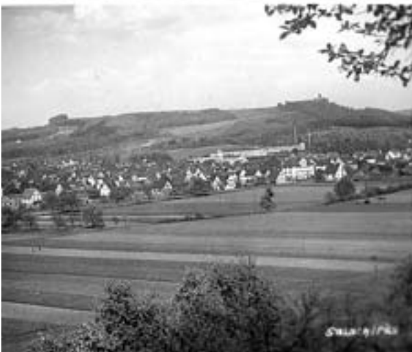
Ansichtskarte Kanalstraße 1 mit dem Haus Dauner/Trippner und Salach aus Südwest.