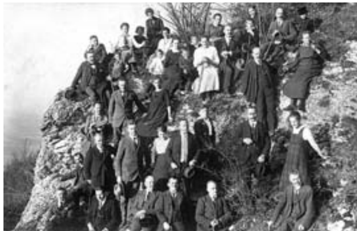
1920 Auf der Fuchseck

2009 Rokoschlossle im Stadtgarten Schwäbisch Gmünd