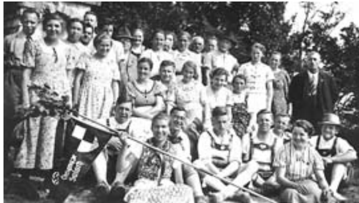
1930er Jahre ... und der Wimpel ist immer dabei