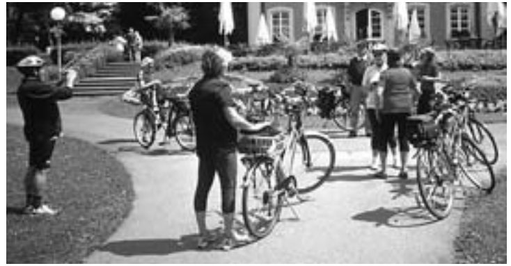
„RADFAHREN das NEUE WANDERN“

2009 Rokoschlossle im Stadtgarten Schwäbisch Gmünd