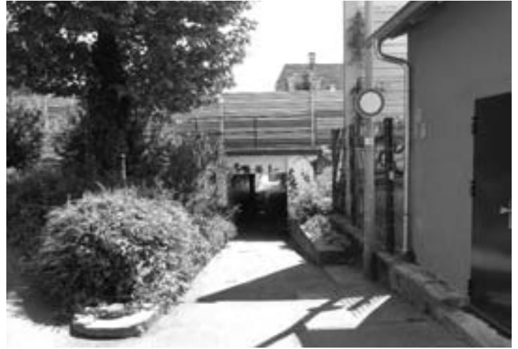
Das Dole soll neu gebaut und deutlich breiter werden.

Gleissperrungen bei der Deutschen Bahn und die Antragstellung der Fördermittel beim Land fristgerecht erfolgen können.