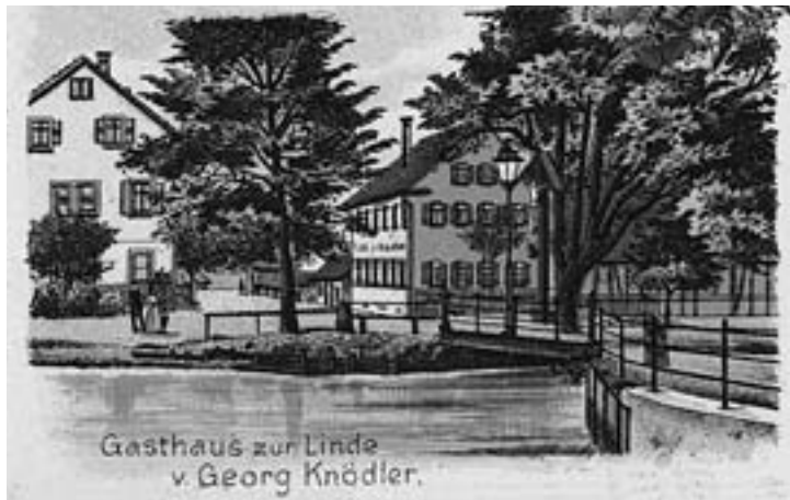
Das Bild zeigt das Gasthaus zur Linde um das Jahr 1900. Im Vordergrund sieht man den ehemaligen Werkkanal.

Ihre Kalendermacher Sepp Burkhardtmaier & Karl Winter