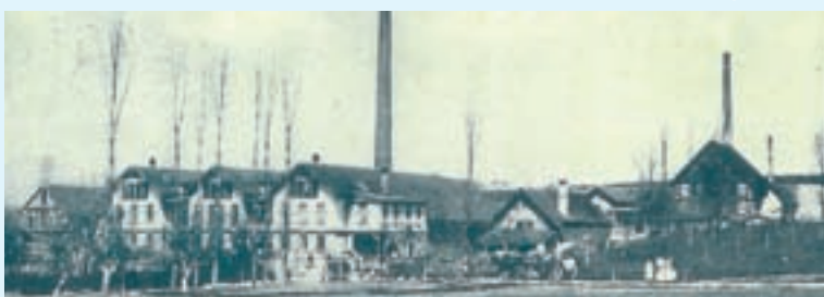
Die ehemalige Ziegelei Bürk und Vetter an der Straße nach Bärenbach