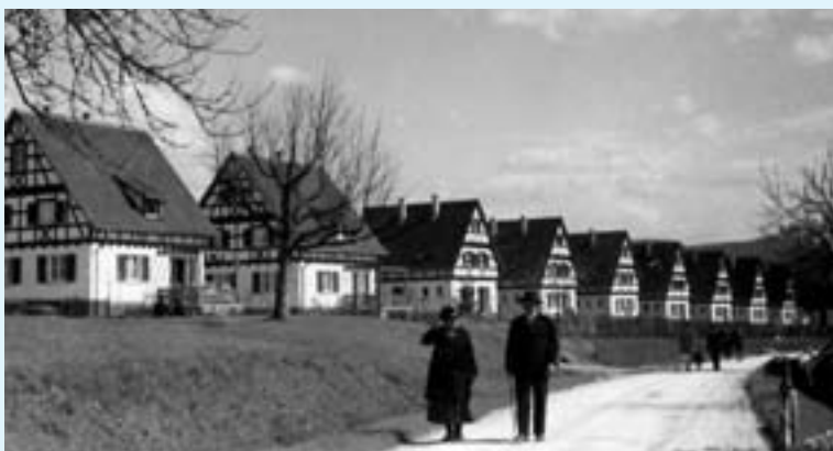
Die Schachenmayr-Siedlung an der Straße nach Krummwälden