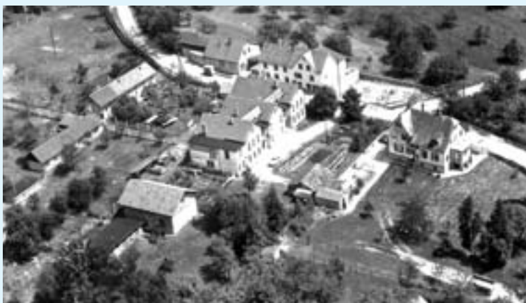
Der Geflügelhof von Adolf Allmendinger an der Ziegelstraße